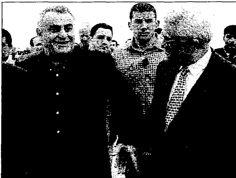
ابو مازن وموردخاي لدى لقائهما الجمعة في غزة